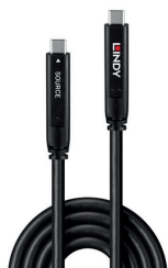
43398 - Câble hybride USB 3.2 Gen 2 et DP 1.4 Type C de 10 m