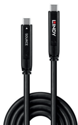
43399 - Câble hybride USB 3.2 Gen 2 et DP 1.4 Type C de 15 m