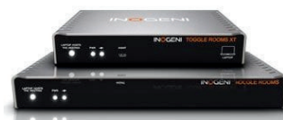
Inogeni Toggle Rooms XT, Commutateur à 3 hôtes pour les appareils USB/HDMI avec une extension