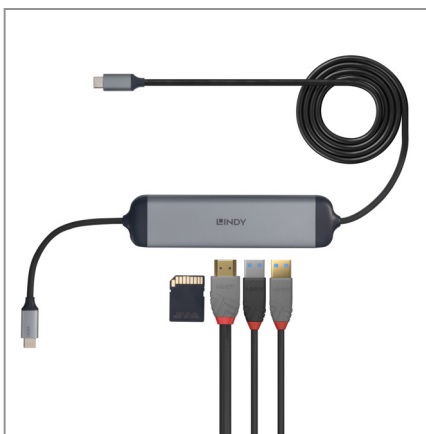
USB Power Delivery [3.0 fino a 60W] per ricaricare il laptop.