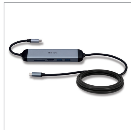
Si collega a qualsiasi computer che supporta USB Tipo C e DisplayPort Alternate Mode.