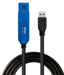
Prolunga Attiva USB 3.0 Pro, 8m

Garantisce prestazioni SuperSpeed a 5 Gbps, con possibilità di collegamento in cascata fino a 40m.