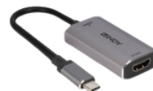
Convertitore da USB Tipo C a HDMI® 8K60

Supporta video fino a 8K60 tramite una porta USB-C, con la semplicità del plug-and-play.