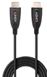
Cavo HDMI® 8K60 Ibrido in fibra ottica, 20m

Garantisce una risoluzione fino a 8K a 60 Hz su lunghe distanze con una larghezza di banda di 48 Gbps.